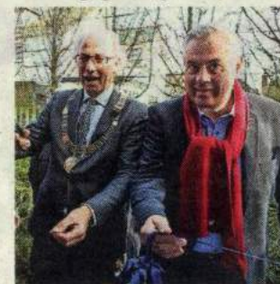
Molkenboer en Ruyten bij de opening.

zorg dan niet nodig. En het is ook erg gezellig: de perfecte